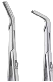
FC230R FC231R 25° 65°