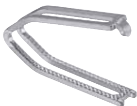
DS (Double-shank) Appendectomy-Clip DS (Doppelsteg) Appendektomie-Clip