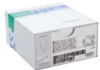
PL475SU Titanium Ligation-Clip, X-large (z) 12 cartridges of 4 clips Titan Ligatur-Clip, X-large (z) 12 Magazine à 4 Clips