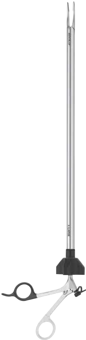
PL809R Laparoscopic Clip Applier, X-large, diam. 12 mm, length 310 mm Laparoskopische Clip Anlegezange, X-large, Ø 12 mm, Länge 310 mm