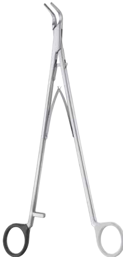
FC230R - FC231R Clip Applier X-large, length 280 mm Clip Anlegezange X-large, Länge 280 mm